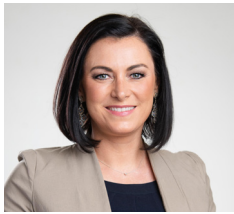
Elisabeth Köstinger Bundesministerin für Landwirtschaft, Regionen und Tourismus

„ Das gute Miteinander von Landwirtschaft und Tourismus auf Österreichs Almen ist mir wichtig. Die Bäuerinnen und Bauern bewirtschaften unsere Naturlandschaften, die Gäste bringen Wertschöpfung in die Region. Mit klaren Verhaltensregeln für die Besucher stärken wir dieses Miteinander für die Zukunft. “