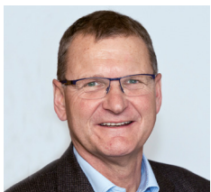
Andreas Ermacora Präsident des Alpenvereins Österreich

„ Der Tourismus zählt zu den zentralen Stützen der heimischen Wirtschaft. Die traditionelle Gastfreundschaft, hervorragende Kulinarik und einzigartige Natur sind besondere Alleinstellungsmerkmale der Urlaubsdestination Österreich. Die Verhaltensregeln auf Almen und Weiden leisten einen wichtigen Beitrag, damit dies auch in Zukunft so bleibt. “